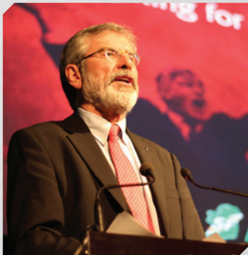
Gearóid Mac Ádaimh TD Samhradh 2015

Beidh cinntí móra roimh mhuintir na hÉireann agus tá plé macánta ag teastáil uainn. Beimid á phlé seo le gach pobal ar fud na hÉireann sa dá mhí dhéag atá romhainn agus sinn ag bogadh i dtreo chomóradh 100 bliain Éirí Amach na Cásca agus idéil an Fhorógra a chur i bhfeidhm.