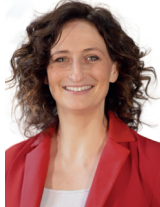
Beidh an Seanadóir Lynn Boylan ina Leas-Chathaoirleach.