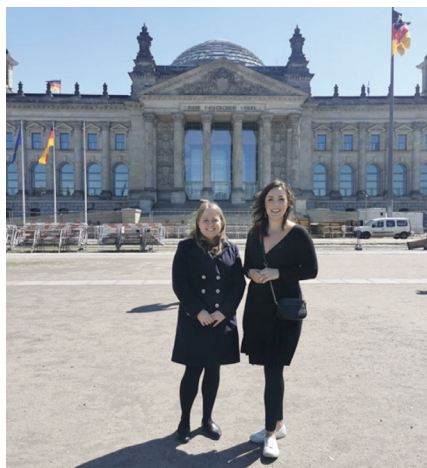
med hensyn til vedvarende energisektoren. "Erfaringerne fra Irland og Tyskland inden for EU,

"Rækken af diskussioner var bred: fra Brexit til EU's sikkerhedsspørgsmål til fremtiden for den europæiske økonomi. Det gjorde det muligt for os at engagere os i disse forskellige spørgsmål gennem prisme af den irske erfaring. Det gav os også det fremtidsperspektiv, som EU-landene ser for Irland