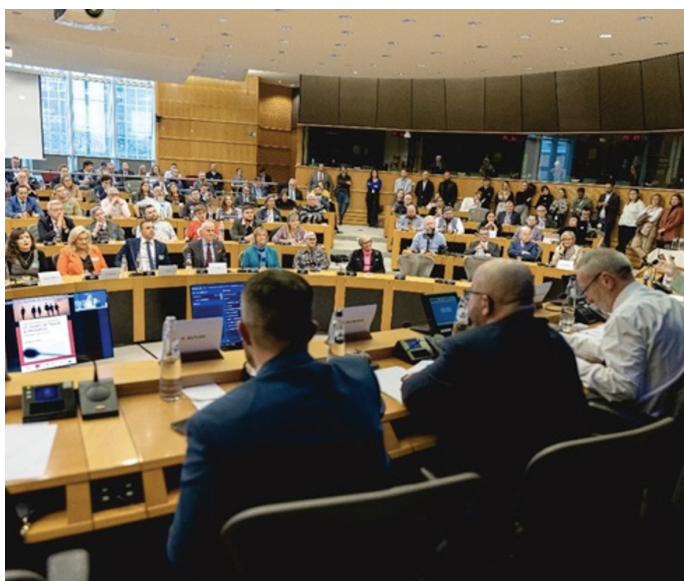
Fyldte sal ved symposium begivenhed om langfredagsaftalen i den Europæiske Parlament, Bruxelles

“Dagens begivenhed sender et klart budskab om, at alle irske MEP'er ikke kun er stolte af den historiske bedrift, men vi vil kæmpe for at beskytte den.”