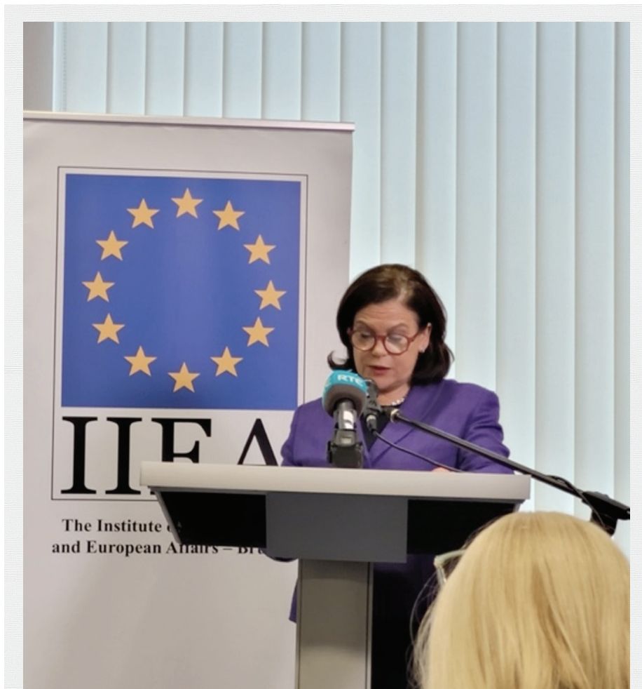
Præsident for Sinn Féin Mary Lou McDonald taler til Institute of International and European Affairs IIEA i Bruxelles

"Det betyder, at vi arbejder sammen for at sikre, at vores folk har billige boliger, adgang til offentlig sundhedspleje og uddannelse