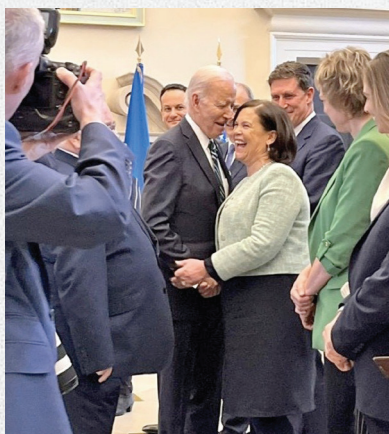
USA-præsident Biden deler en vittighed med Sinn Féin-præsident Mary Lou McDonald

GFA giver et middel til selvbestemmelse. Forfatningsændringer