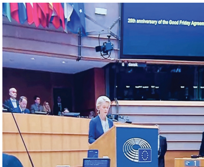
Europa-Kommissionens formand Ursula von der Leyen taler i Europa-Parlamentet i anledning af 25-årsdagen for langfredagsaftalen