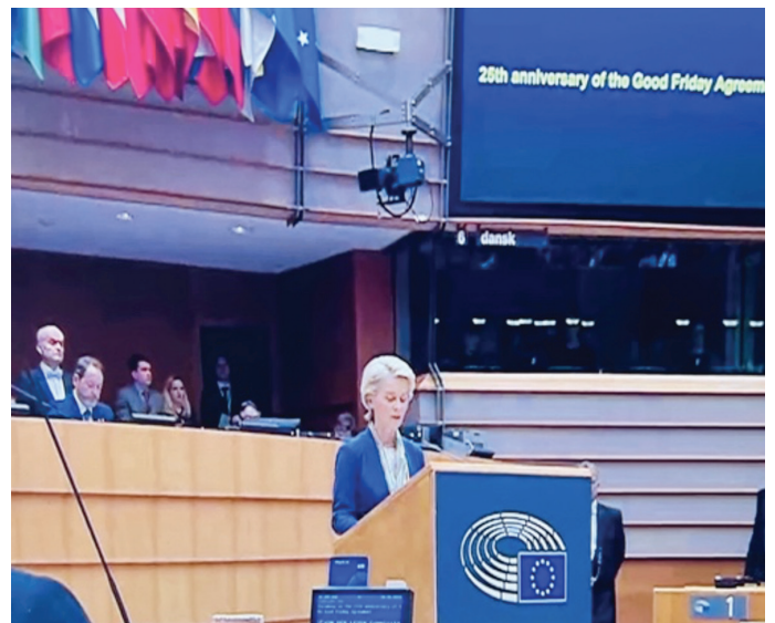
La Présidente de la Commission européenne Ursula von der Leyen s'adresse au Parlement Européen lors du 25ème anniversaire du GFA

“L'événement d'aujourd'hui envoie un message clair que tous les députés européens irlandais sont non seulement fiers de ce résultat historique, mais que nous nous battons pour le protéger.”