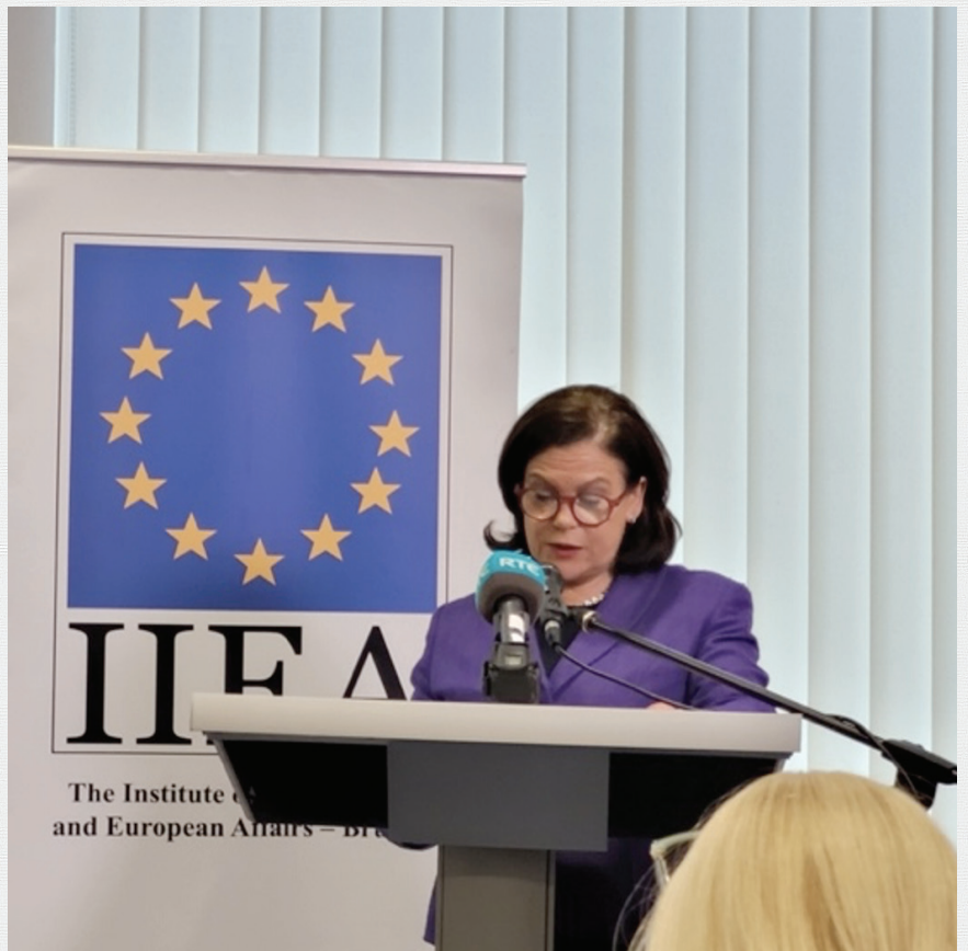
La Présidente du Sinn Féin Mary Lou McDonald à l'Institut des Affaires Internationales et Européennes de Bruxelles

« Pour renforcer l'Union européenne, nous devons renforcer sa légitimité démocratique et construire un avenir auquel chaque femme, homme et enfant participe réellement.