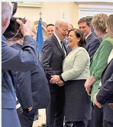
Le Président des Etats-Unis Joe Biden et la Présidente du Sinn Féin Mary Lou McDonald

Les tentatives de remise en cause du principe du consentement, principe inscrit dans le GFA, en suggérant de nouvelles garanties constitutionnelles et des amendements à la loi de 1998, seront inacceptables.