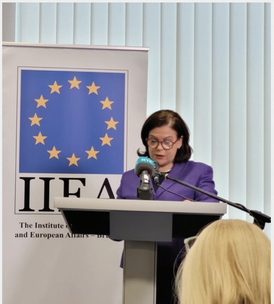
Sinn Féins partiledare Mary Lou McDonald talandes i Bryssel.

"Det innebär att arbeta tillsammans för att säkerställa att vårt folk har bostäder till rimligt pris, tillgång till sjukvård och