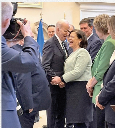
President Biden skojar med Sinn Féins partiledare Mary Lou McDonald.

Försök att omstörta samtyckesprincipen som Långfredagsavtalet slår vakt om, med förslag om nya konstitutionella garantier och ändringar till 1998-års lag kommer att vara oacceptabelt.