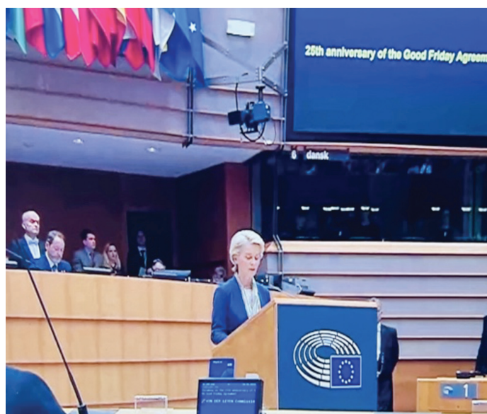
EU-kommissionens ordförande Ursula von der Leyen talandes på Långfredagsavtalets 25-årsjubileum i Europaparlamentet.