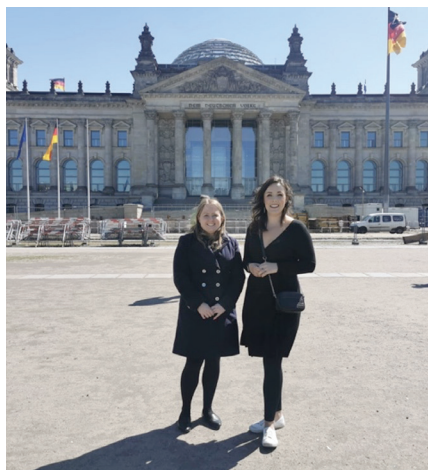
"Irlands erfarenheter av EU skiljer sig stort jämfört med Tysklands, som ju är den största ekonomin."

"Diskussionerna berörde många ämnen, från Brexit, till EU, till säkerhetsfrågor, till den europeiska ekonomins framtid. Det gav oss möjlighet att lyfta dessa frågor genom från ett irländskt perspektiv. Det gav oss också en blick mot den framtid som EU-länder ser för Irland gällande den förnybara energisektorn."